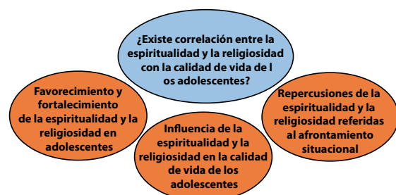
Figura 2. Categorías temáticas establecidas a partir del análisis de los artículos incluidos en la revisión integrativa.